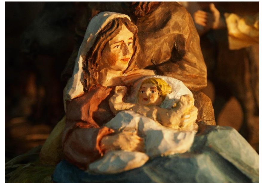
Krippenfigur von Georg Lanzinger im Krippenmuseum, Muri Gries

Pfarrblatt Nr. 12 vom 30.11.2024. bis 7.1.2025